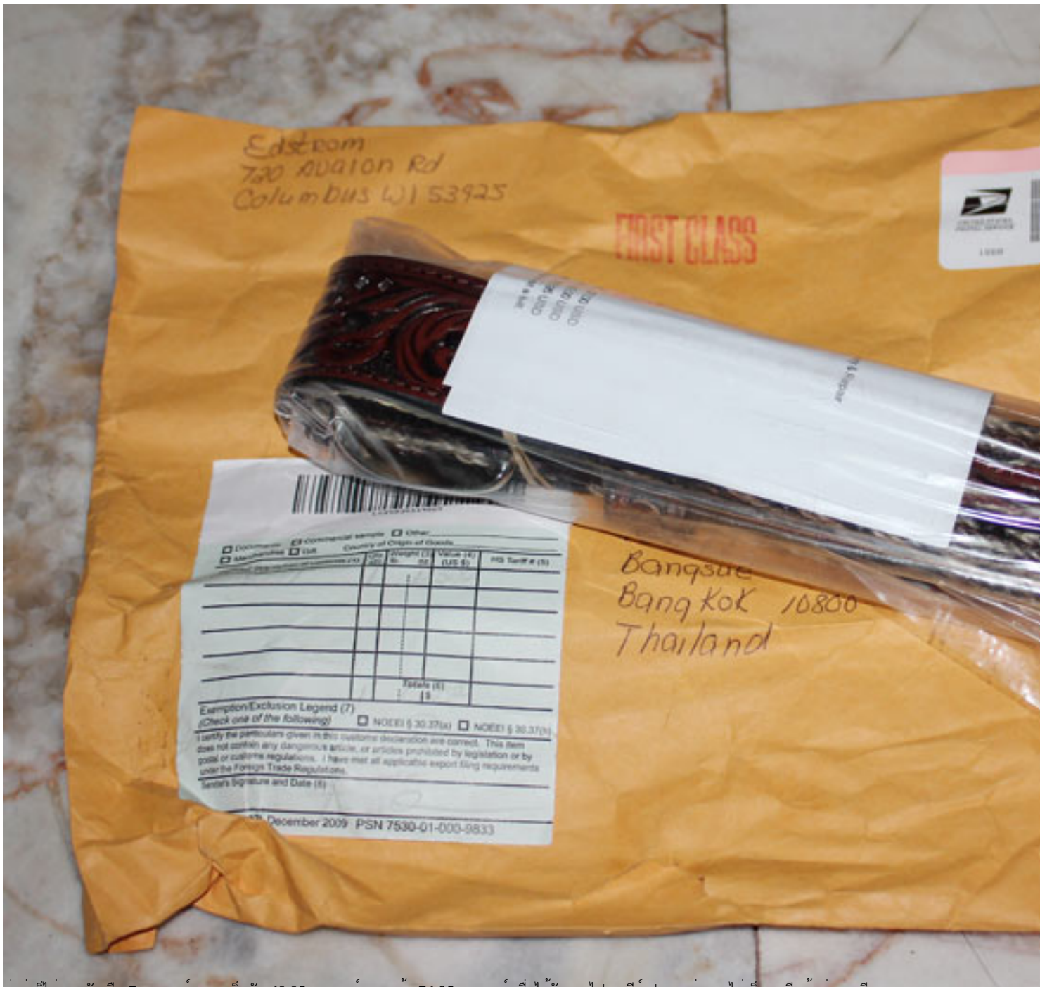
คำสั่งก็ไม่แพงนัก คือ 7 ดอลลาร์ ราคาเข็มขัด 69.95 ดอลลาร์ รวมแล้ว 76.95 ดอลลาร์ เมื่อได้รับทางไปรษณีย์ ปรากฏว่า เขาไม่เก็บภาษีแม้แต่บาทเดียว