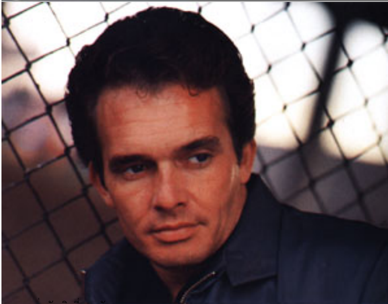
เขาละ เล่นกับ วิสตี เนลสัน