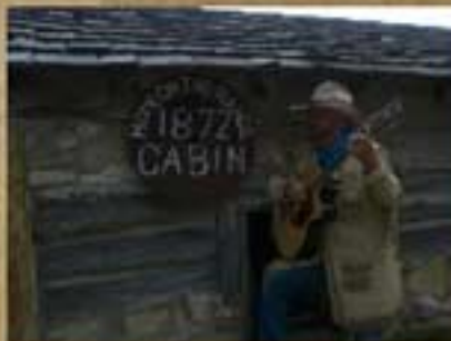
Home on the Range Historical Cabin

What a pleasure it was to help raise over $20,000 for restoration of the cab Home on the Range was written!