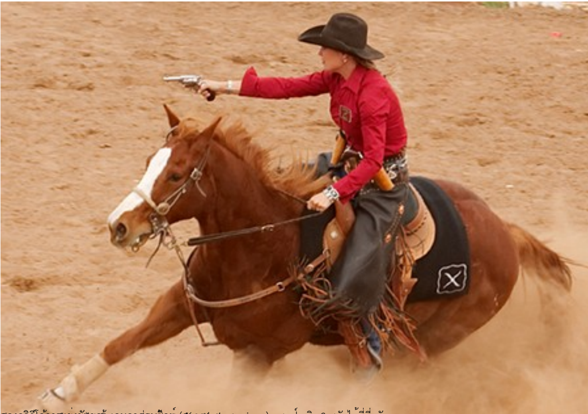
สองตัวนี้ได้ลงแข่งที่สนามแข่งคาวบอย (Knoxville Tennessee) และจบถึง 3 ลำดับที่ที่คว้า