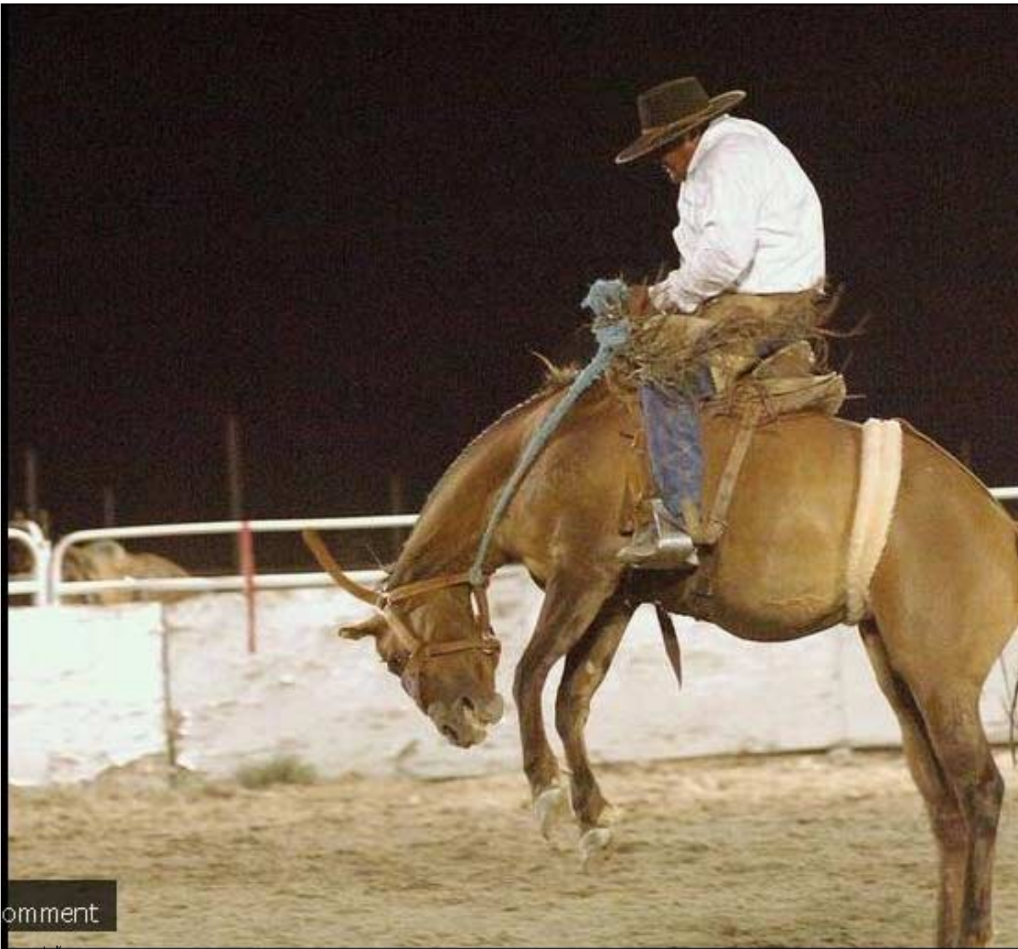
เด็ก ๆ ที่ได้รับเลือกเป็นเทพของงาน Eureka County Fair 2011

วันพฤหัสบดีที่ 18 สิงหาคม 2011 เวลา 00:49 น. - แก้ไขล่าสุด วันพฤหัสบดีที่ 18 สิงหาคม 2011 เวลา 02:17 น.